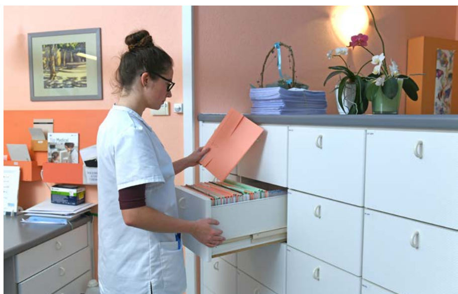
^ Dopo ogni consultazione, le cartelle dei pazienti vengono aggiornate.

«Per il futuro vorrei continuare per un po' a esercitare questa professione e poi svolgere una formazione continua», aggiunge la giovane. «Ci sono diverse