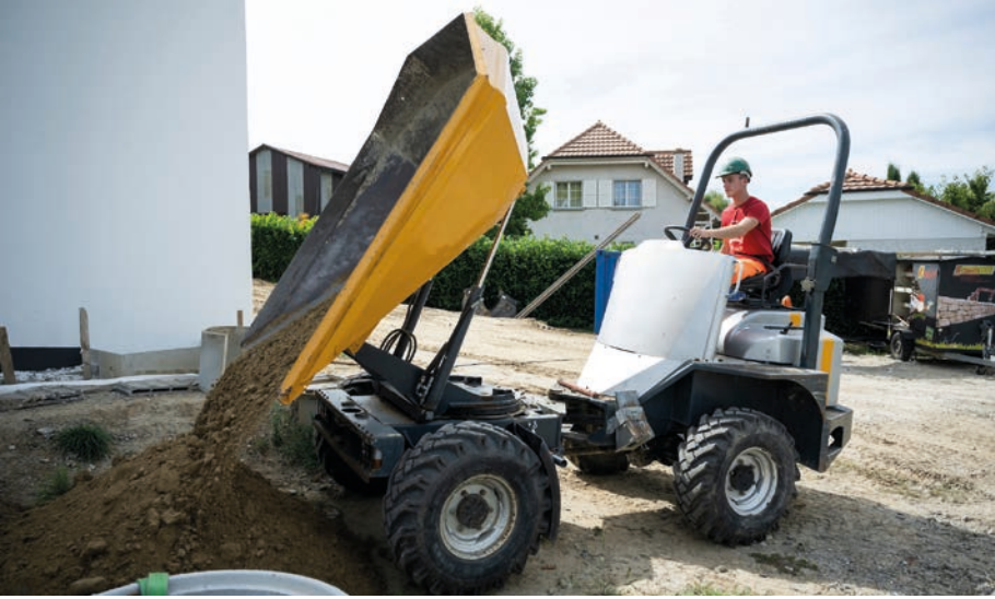
◀ Yanick rimuove la terra in eccesso.