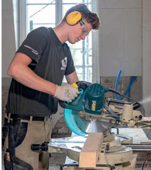
< Segare e tagliare Per tagliare e adattare singoli componenti, i carpentieri e le carpentiere utilizzano diversi utensili, ad esempio frese e seghe.

> Impiego di macchinari speciali Gli elementi da costruzione in legno sono a volte imponenti: per produrli i professionisti impiegano macchine di grandi dimensioni, ad esempio sezionatrici.