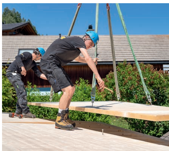
< Montaggio sul cantiere Travi, tavole e altri elementi prefabbricati in officina vengono adattati alla costruzione e montati.

^ Misurare Gli elementi da costruzione in legno devono adattarsi perfettamente, essere ermetici e assolvere funzioni portanti. Ciò si può ottenere solo se i professionisti misurano gli spazi con precisione.