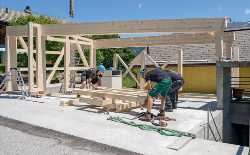
^ Lavoro di squadra Nella fabbricazione di grandi elementi di costruzione in legno in officina, ma anche durante i lavori sul cantiere è necessaria grande collaborazione.