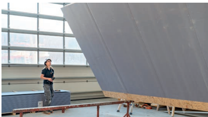
^ Caricare e trasportare Il carico e il trasporto di materiale fanno parte della quotidianità dei carpentieri e delle carpentiere. Spostano elementi di grandi dimensioni con l'ausilio di carricette.