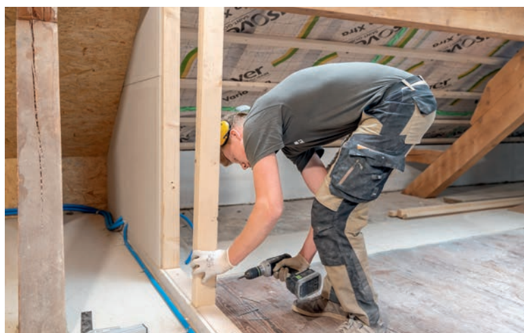
^ Finiture interne Questi professionisti lavorano non solo sui tetti, ma anche negli spazi interni, inserendo ad esempio pareti divisorie.