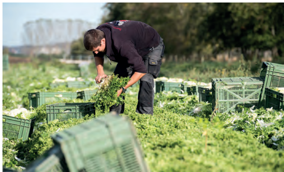
^ Quando si raccoglie l'insalata bisogna anche eliminare le foglie rovinare e tagliare il fusto.

Le giornate di pioggia o invernali sono dedicate alla manutenzione delle