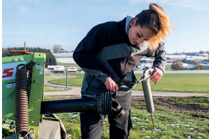
^ Per garantire la sicurezza sul lavoro, i veicoli agricoli devono essere controllati regolarmente.

La giovane professionista è inoltre responsabile dell'allevamento di circa 6000 polli da ingrasso all'interno di un grande capannone adiacente alla