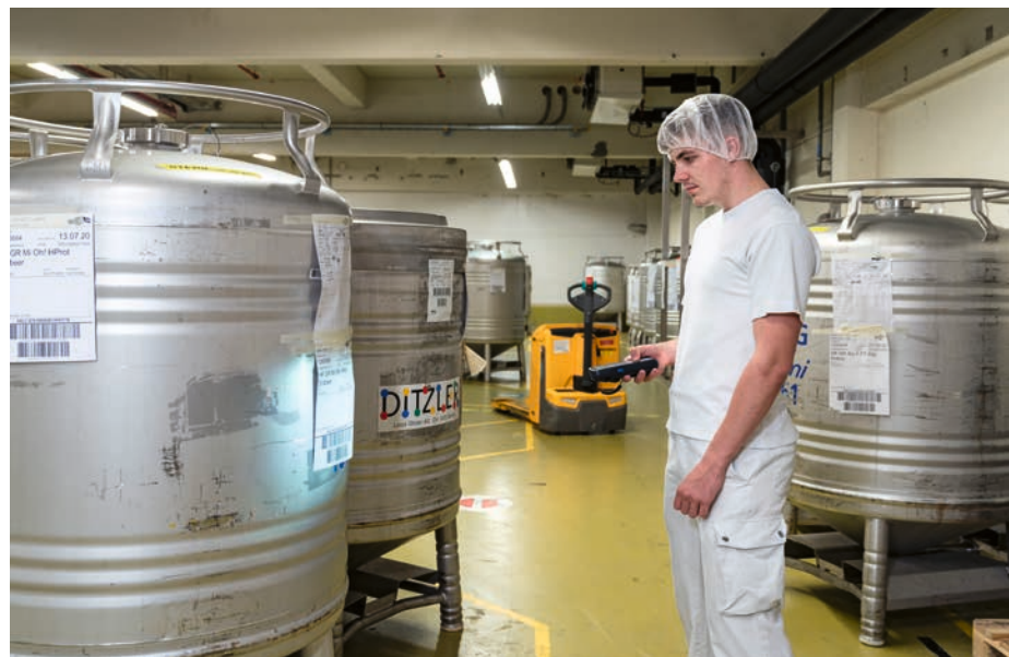
Pour éviter toute erreur, chaque composant est scanné avant d'être ajouté au produit.