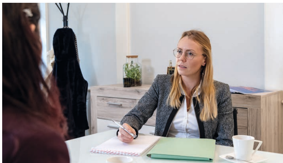
^ L'avocat représente son client. Établir un lien de confiance avec lui est essentiel.