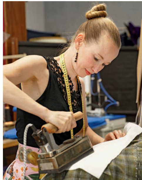
✓ Les vêtements n'obtiennent leur forme définitive que grâce au fer à repasser.

Cette technique s'appelle l'entoilage. La jeune femme n'utilise que les meilleurs tissus fabriqués en Angleterre ou en Italie. «Une laize d'un mètre de ce type coûte plusieurs centaines de francs. Je dois être très concentrée car les erreurs peuvent non seulement ruiner des dizaines d'heures de travail, mais aussi coûter très cher.»