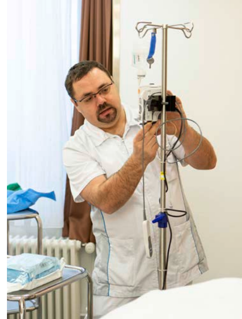
Les sages-femmes préparent le matériel nécessaire à un accouchement.

«Nous travaillons douze heures d'affilée. Cela nous permet, dans la mesure du possible, d'éviter les changements d'équipe durant un même accouchement et de suivre les parturientes jusqu'à la naissance de leur enfant. Il est essentiel de créer un lien de confiance afin de pouvoir rassurer nos patientes», souligne ce professionnel. «C'est d'autant plus important en cas de complication: si une césarienne s'avère nécessaire, cette confiance permet aux parents de vivre cette