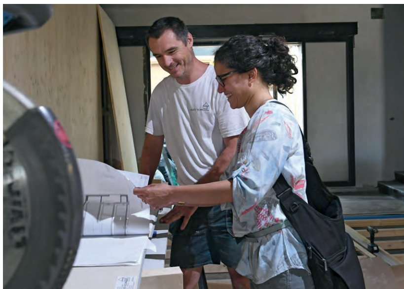
> Au Musée d'Ethnographie, l'architecte contrôle que les aménagements intérieurs correspondent aux projections.

À propos de son travail, elle précise encore: «Je m'occupe principalement des aspects administratifs des projets: suivis de chantiers, appels d'offres, procédures, justification des choix, paiement des factures, etc. En arrière-fond, nous avons toujours en tête que c'est l'argent du contribuable que nous utilisons. Nous devons donc faire particulièrement attention aux dépenses engagées et nous devons constamment les justifier. Sensibiliser les nouveaux élus à chaque changement de législature fait aussi partie du jeu. Le travail créatif, projet et dessin, ne représente finalement qu'une faible partie de nos tâches!»